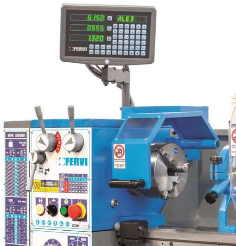
Un dettaglio del tornio professionale T997-400V3A di FERVI .